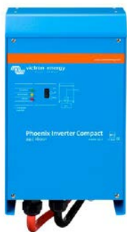
Phoenix omvormer Compact 24/1600

Het enorme uitgangsvermogen dat bereikt wordt door parallelschakeling van Phoenix omvormers biedt ongekende mogelijkheden. Voor ideeën, voorbeelden en accucapaciteit berekeningen bevelen wij ons boek 'Altijd stroom' aan. Gratis verkrijgbaar bij Victron Energy en beschikbaar op www.victronenergy.com