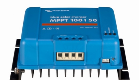
Solar Charge Controller MPPT 100/50