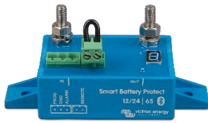
Smart BatteryProtect BP-65