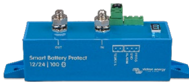
Smart BatteryProtect BP-100