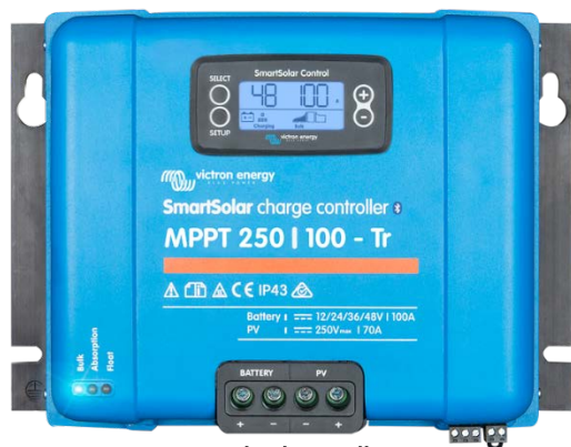
Zonne-laadcontroller MPPT 250/100-Tr met koppelbaar display

Compenseert absorptie- en druppellaadspanning aan de hand van de temperatuur.