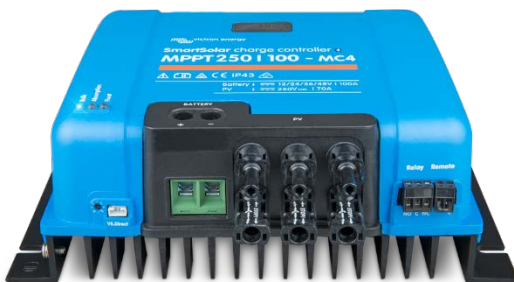
Zonne-laadcontroller MPPT 250/100-MC4 zonder display