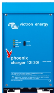
Phoenix Lader 12V 30A