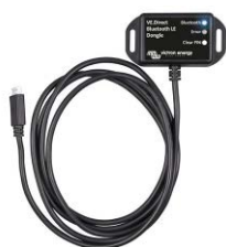
VE.Direct Bluetooth Smart dongle (moet apart worden besteld)

De BMV Battery Monitor combineert een geavanceerd microprocessorsysteem met zeer nauwkeurige meetsystemen voor meting van de accuspanning en de laad-/ontlaadstroom. Daarnaast bevat de software complexe berekeningsalgoritmen om de actuele laadtoestand van de accu precies te kunnen bepalen. De BMV geeft selectief de accuspanning, stroom, verbruikte Ah of resterende tijd weer. De monitor slaat bovendien belangrijke gegevens betreffende de prestaties en het gebruik van de accu op.