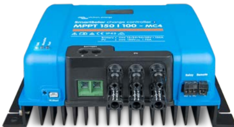
SmartSolar laadcontroller MPPT 150/100-MC4 zonder display