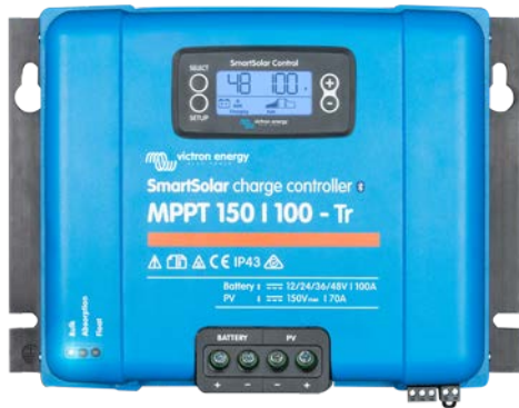
SmartSolar laadcontroller MPPT 150/100-Tr met koppelbaar display