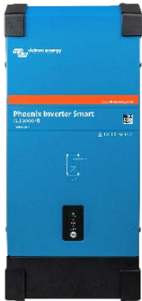
Phoenix Omvormer Smart 12/2000