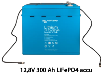
12,8V 300 Ah LiFePO 4 accu

Met Bluetooth kunnen cel voltages, temperatuur en alarmstatus worden gecontroleerd. Zeer nuttig om (potentiele) problemen, zoals cel onbalans, te lokaliseren.